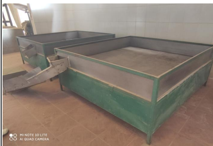
MESAS DE SECADO