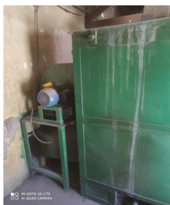
INTERCAMBIADORES DE CALOR