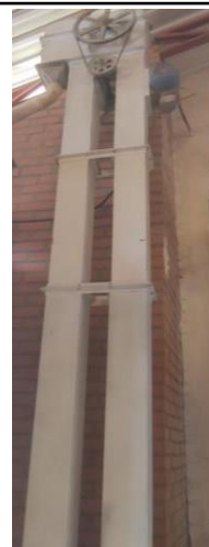
ELEVADOR DE CANGILONES