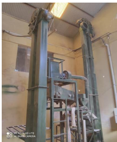
AREA DE ESCARIFICADO