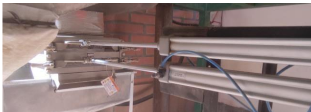
SEPARADOR DE PIEDRAS