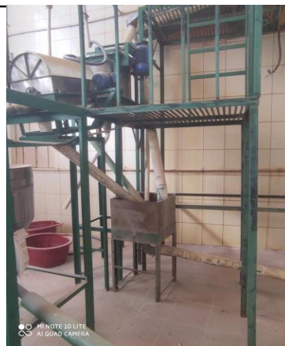
AREA DE LAVADO