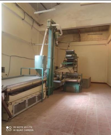
AREA DE SELECCIÓN