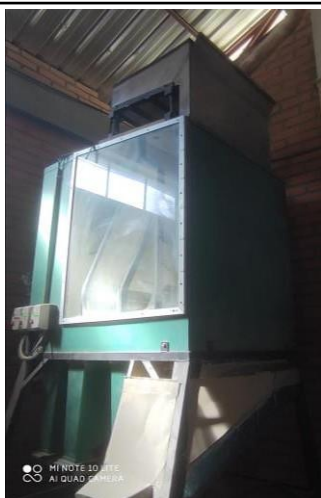
SEPARADOR DE PAJAS Y GRANOS PEQUEÑOS